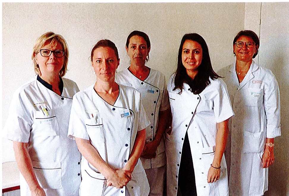
Figure 2. L'équipe Handi-Relais.

[3] Handidactique. Charte Romain Jacob. www.handidactique.org/charte-romain-jacob .